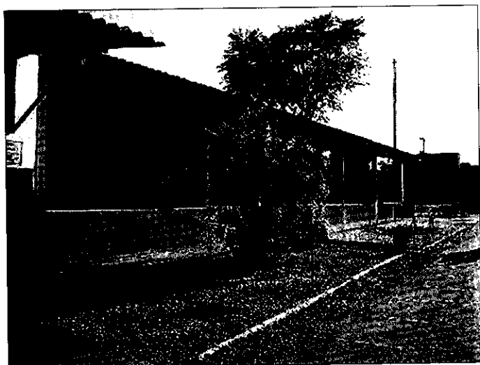
Na trawniku przed szkołą rosną palmy.