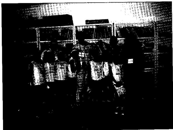
W szkolnym klubie języka esperanto.